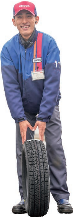
ウミライ淀江なかまSS